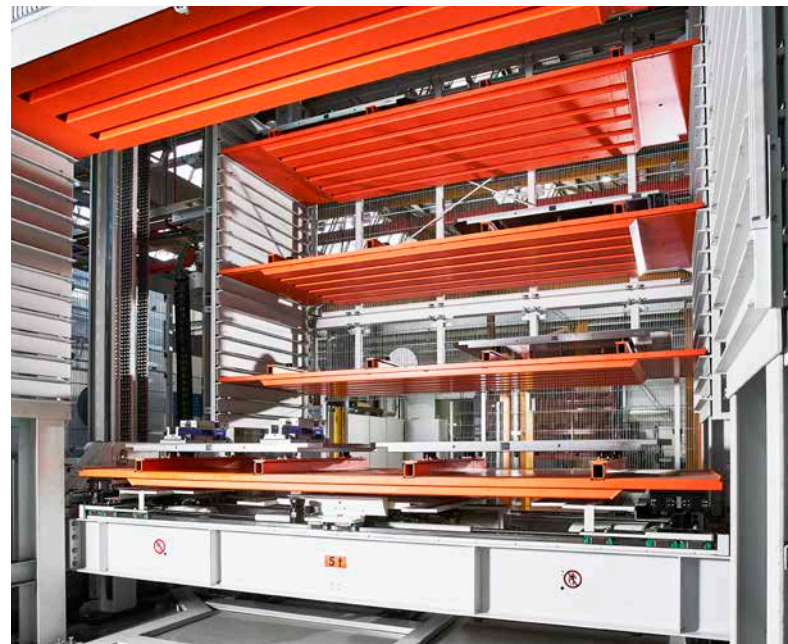
Turmlager mit Regalbediengerät zur Vorpufferung für die CNC Bearbeitungsmaschinen