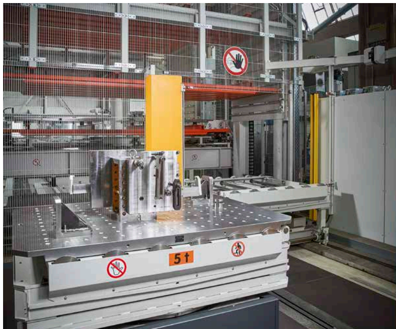
Rüstplatz für Vorrichtungen

Management über Lagerverwaltungssoftware KASTOlogic